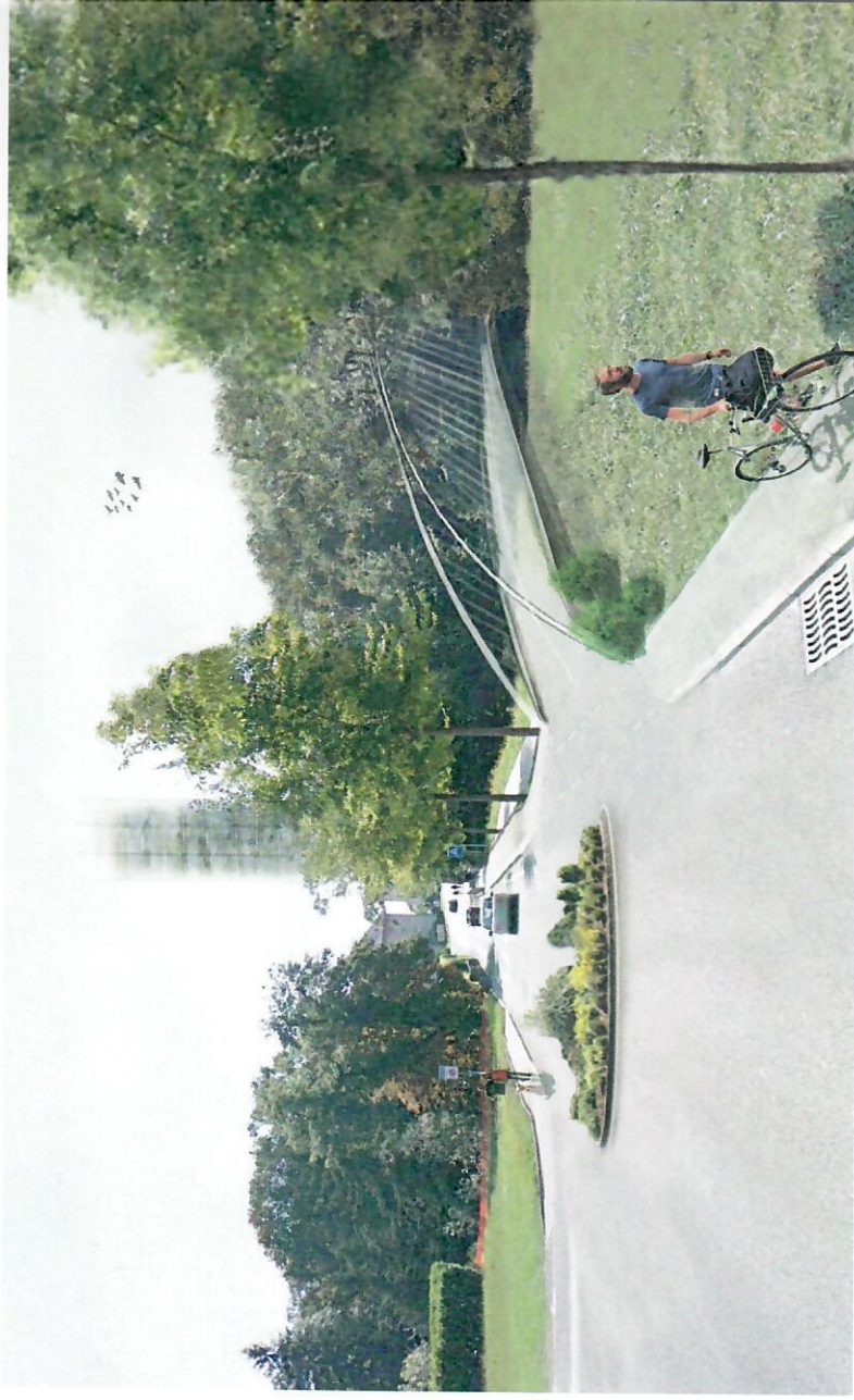
Création d'un rond-point et d'une passerelle pour un accès direct à Perdtemps, à la gare, au Martinet